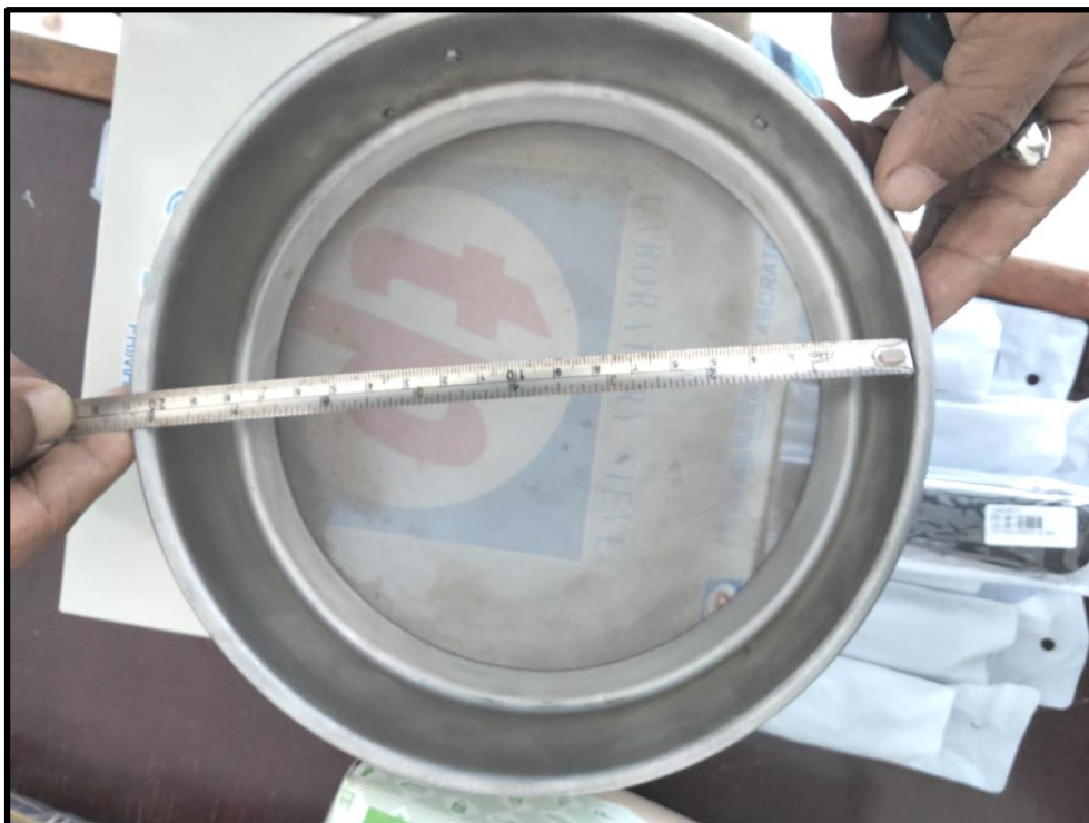
Gambar 4: Saringan dia. 8" uk. No. 200 (0,075 mm)