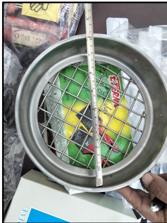
Gambar 2: Saringan dia. 8" uk. 5/8" (16,0 mm)