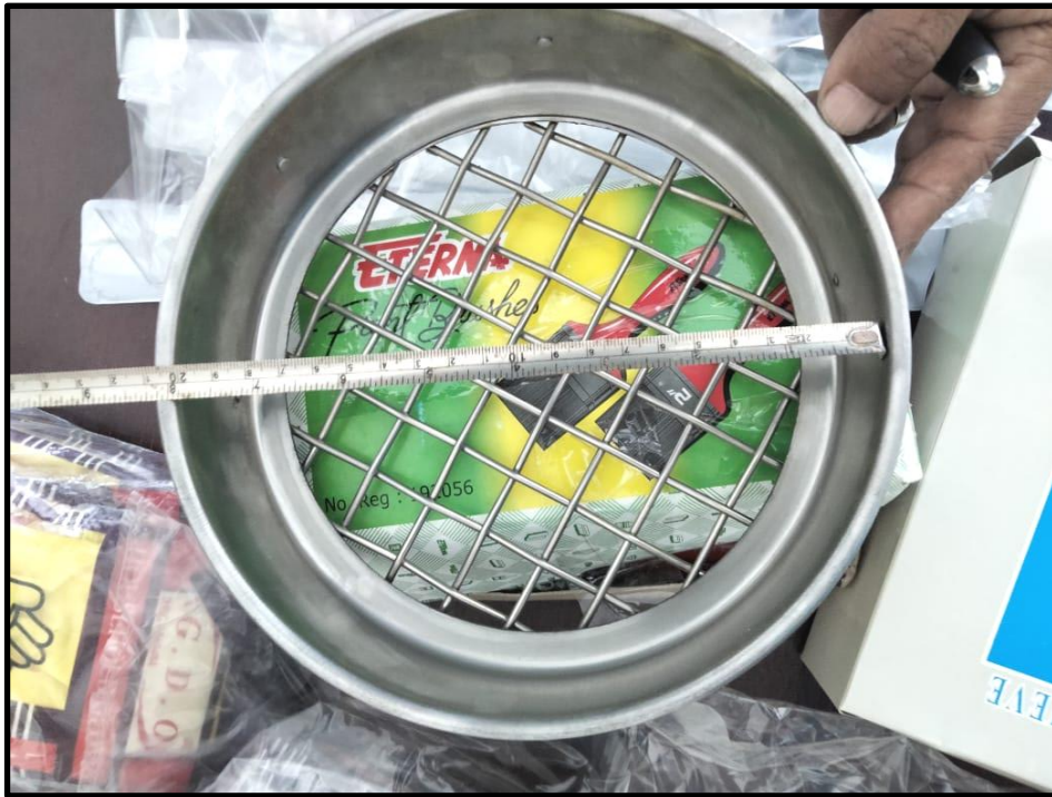
Gambar 1: Saringan dia. 8" uk. 3/4" (19,0 mm)

Belanja Modal Alat Laboratorium Bahan Bangunan Konstruksi