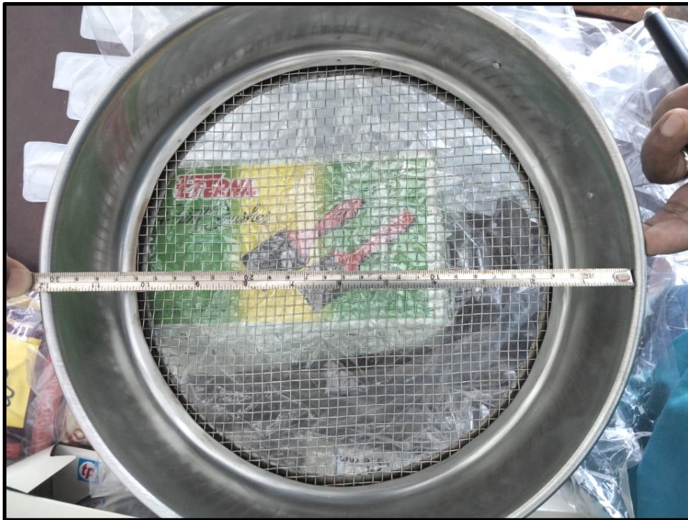
Gambar 3: Saringan dia. 12" uk. No. 4 (4,75 mm)