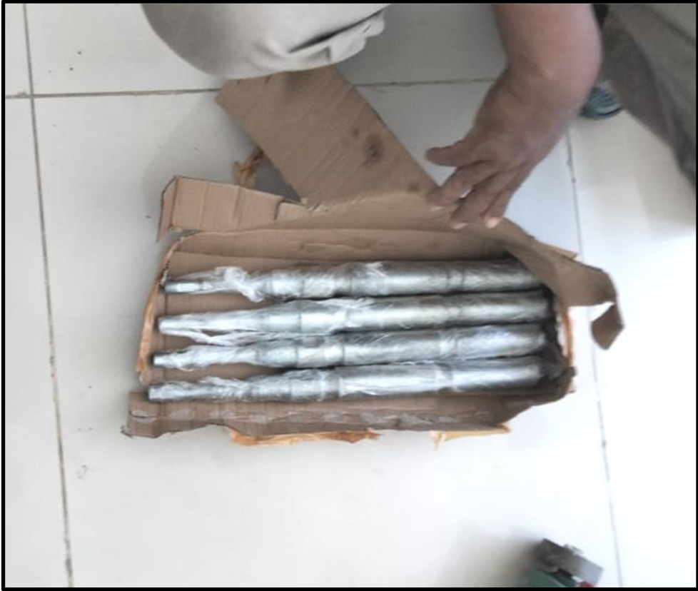
Gambar 5: Biconus Sondir